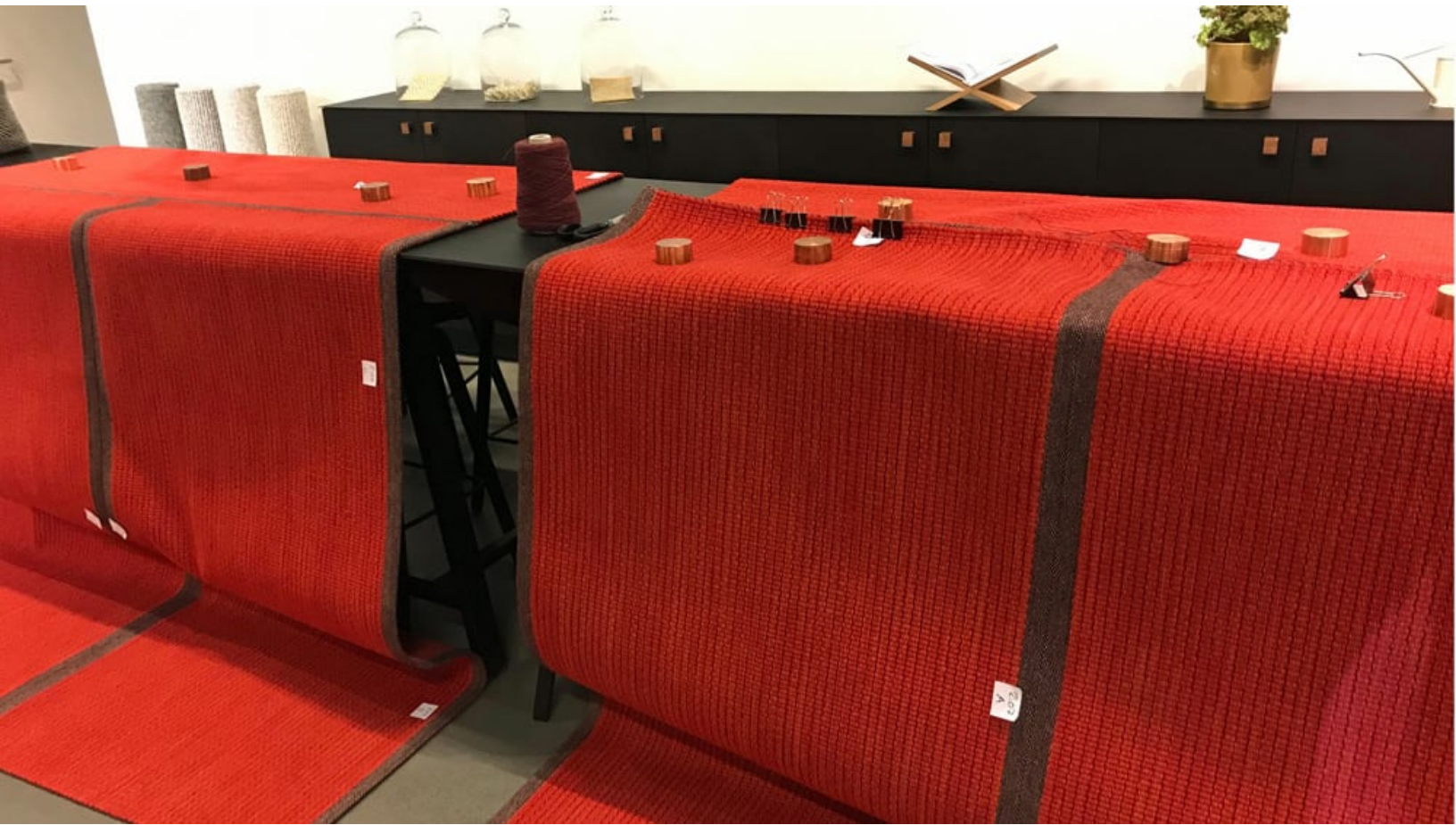
Kasthallsignerade Tatamimattor av Claesson Koivisto Rune